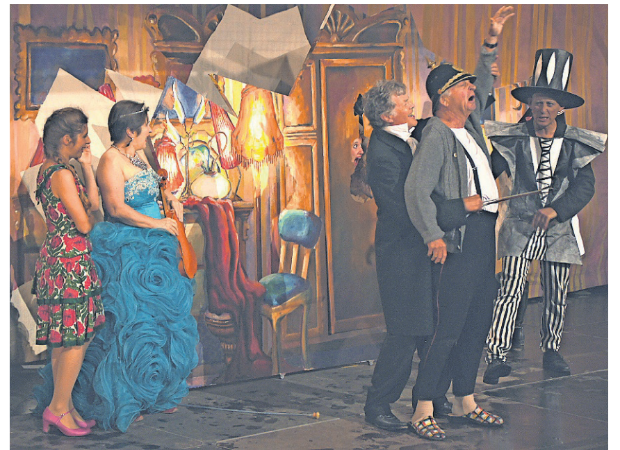
Eitelkeit, Eifersucht und weitere Unzulänglichkeiten der Gesellschaft werden offenbar. Hinter den Schauspielern die von Anna Deér handgemalte Kulisse.

Ein mutiges Stück, das sich die Aemtler Bühne zu ihrem Jubiläum vorgenommen hat. Das Opernlibretto von Kurt Schwitters – 1976, fast dreissig Jahre nach seinem Tod, uraufgeführt und von seiner Thematik her heute mehr denn je aktuell – ist höchst vielschichtig, verzahnt und verwirbelt. Der Zuschauer wird allerdings im Kloster Kappel von der Aemtler Bühne an der Hand genommen und sanft wie schlüssig durch den Abend und die Handlung geführt. So gibt der «Zusammenstoss» einerseits restlos Raum, die Unzulänglichkeiten der Gesellschaft, der Menschheit schlechthin und damit auch sich selbst zu entdecken, andererseits er-